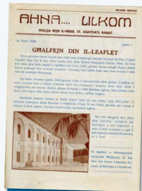
L-ewwel harġa tal-'Ahna Lilkom', fl-1959

Inhoss li għandna ngħidu GRAZZI KBIRA lil Alla għal dawn il-hamsin sena, u xejn inqas lilkom qraba , benefatturi u hbieb tagħna għax wara Alla intom għandkom sehem kbir fil-missjoni li aħna qed inwettqu kull fejn qed naħdmu. Nieħdu gost jekk tibktbulna u tghidulna dak kollu li thossu fuq l-"AHNA LILKOM".