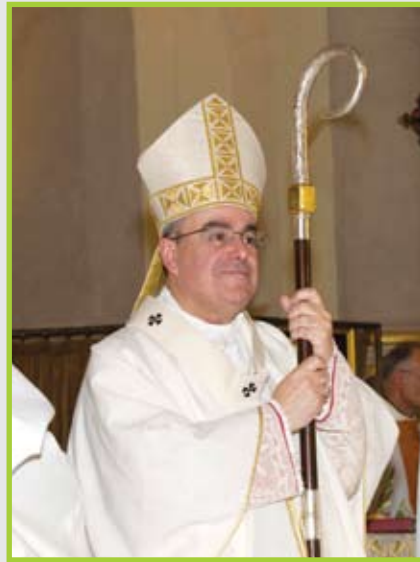
Pawlu Cremona O.P. † Arcisqof ta' Malta

Ovjament dan kollu iservi mhux biss għal dawn l-għanijiet, iżda għaliex jiġi f'idejn hafna iktar persuni li b'hekk jikbru fil-Fidi Missjunarja u fil-Qdusija.