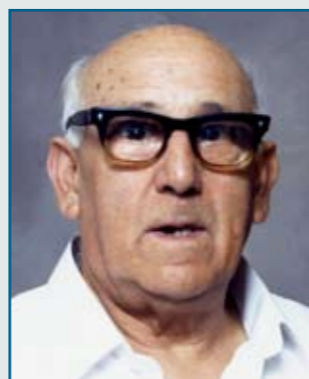
Dun Alwig Gatt