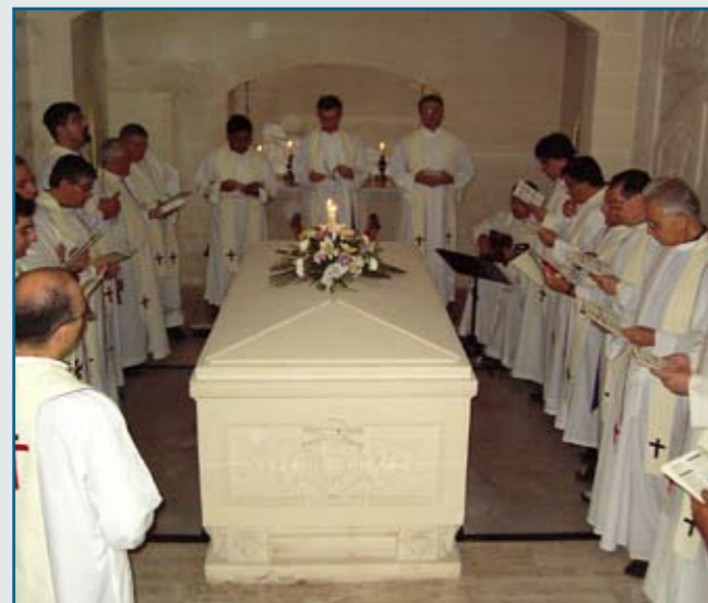
Il-qabar ta Mons. De Piro