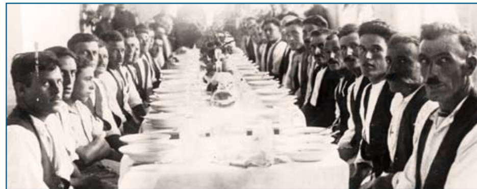
Waqt il-pranzu li sar ghall-haddiema