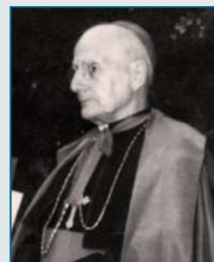
L-Arcisqof M. Gonzi

Il-mewt tal-Fundatur ma setghetx ma ggibx maghha hafna tibdil fl-esekuzzjoni tal-progetti. Kien hemm ukoll qtiegħ il-qalb kbir fis-Socjeta, speċjalment min ser ikun responsabli. Ghax ghalkemm bi ftit diffikultajiet, jista' jinstab successur f'kull hidma. Imma l-Fundatur huwa wiehed, u 'l dan hadd ma jista' jehodlu postu. Hadd daqsu ma jista' jkollu qalb ta' missier ghall-opra mibdiija minnu.