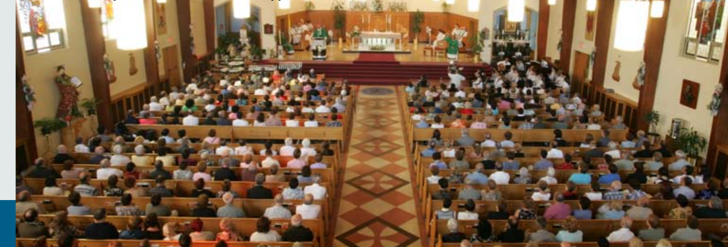
Il-Parroċċa Maltija - Kanadiża ta' San Pawl Appostlu