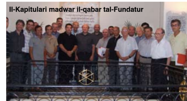
Il-Kapitulari madwar il-qabar tal-Fundatur

Kull Ordni jew Kongregazzjoni Religjuża, kull tant zmien, kulhadd skont il-kostituzzjonijiet tiegħu, hija obligata li tagħmel dak li jissejjah Kapitu. Dan jikkonsisti fl-laqqgħat bejn il-membri ta' dik l-ordni jew il-kongregazzjoni.